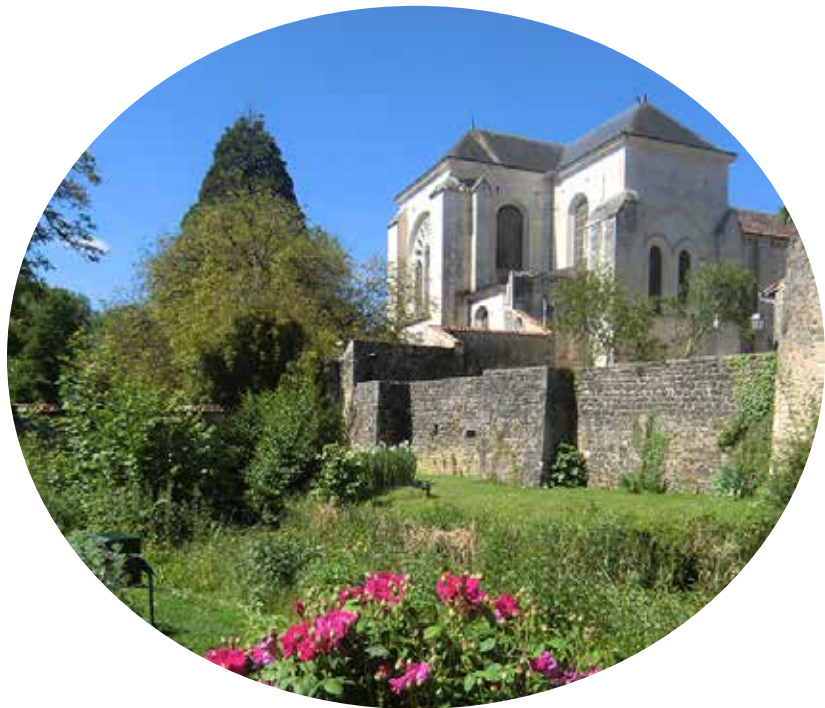
Jardin d'inspiration médiévale et chevet de l'église Saint-Junien