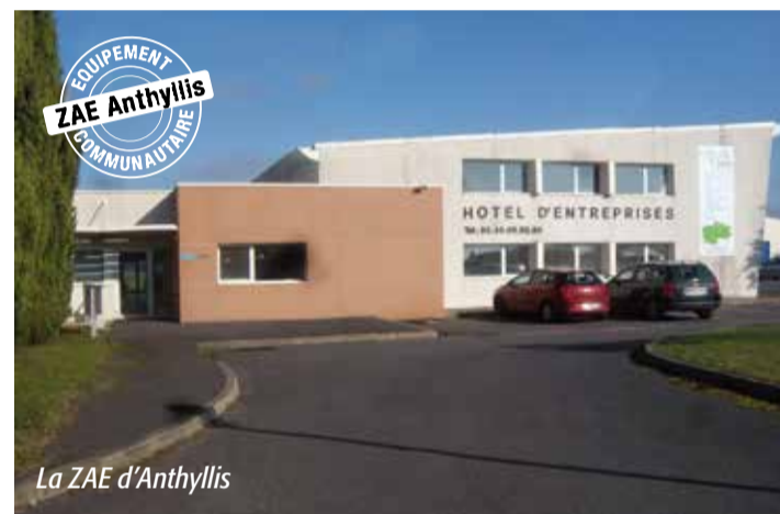
La ZAE d'Anthyllis

Un des objectifs majeurs pour la commission concerne l'implantation d'entreprises sur ces ZAE. Parallèlement à cela, elle veille également à maintenir un lien avec les entreprises implantées sur le territoire. Ainsi, un questionnaire leur a été envoyé mi-octobre afin de recenser et de mieux connaître les acteurs du tissu économique local. La commission s'est, d'ores et déjà, fixée pour but de devenir le guichet communautaire pour aider les entreprises dans leurs démarches (lien avec les chambres consulaires, montage de dossiers de subventions, accès à la formation ...).