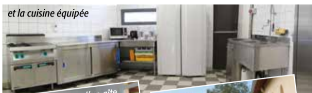
et la cuisine équipée

Depuis juin 2010, les gîtes sont classés en meublés de tourisme 2 étoiles par la Préfecture. Ainsi, le village de gîtes figure dans les publi-