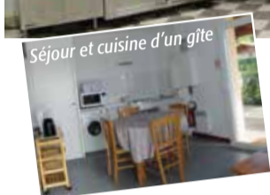
Séjour et cuisine d'un gîte