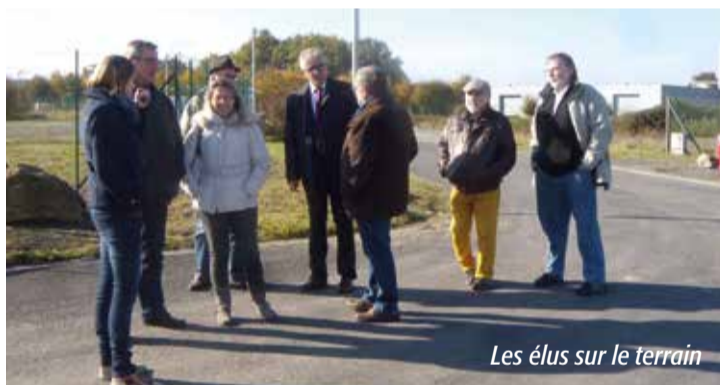
Les élus sur le terrain

Depuis sa mise en place, la commission se réunit une fois par mois. Des visites de terrain ont permis aux élus d'appréhender au mieux la réalité des enjeux économiques et le travail concret à mener au sein des zones d'activités économiques existantes pour en définir les grands axes de la stratégie de développement économique communautaire.