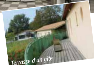
Terrasse d'un gîte