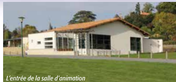
L'entrée de la salle d'animation

cations et dans toutes les diffusions d'hébergement émises par l'Agence Touristique