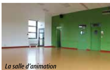
La salle d'animation

Vendredi 23 janvier - 20h30 à Nouaillé-Maupertuis, La Passerelle salle intercommunale de spectacles (1 rue du stade). Tout public. Durée 1h15. Entrée 16 ou 12 € réduit. Info/résa. 05 49 42 05 74 (Du mardi au vendredi) larantelle@wanadoo.fr